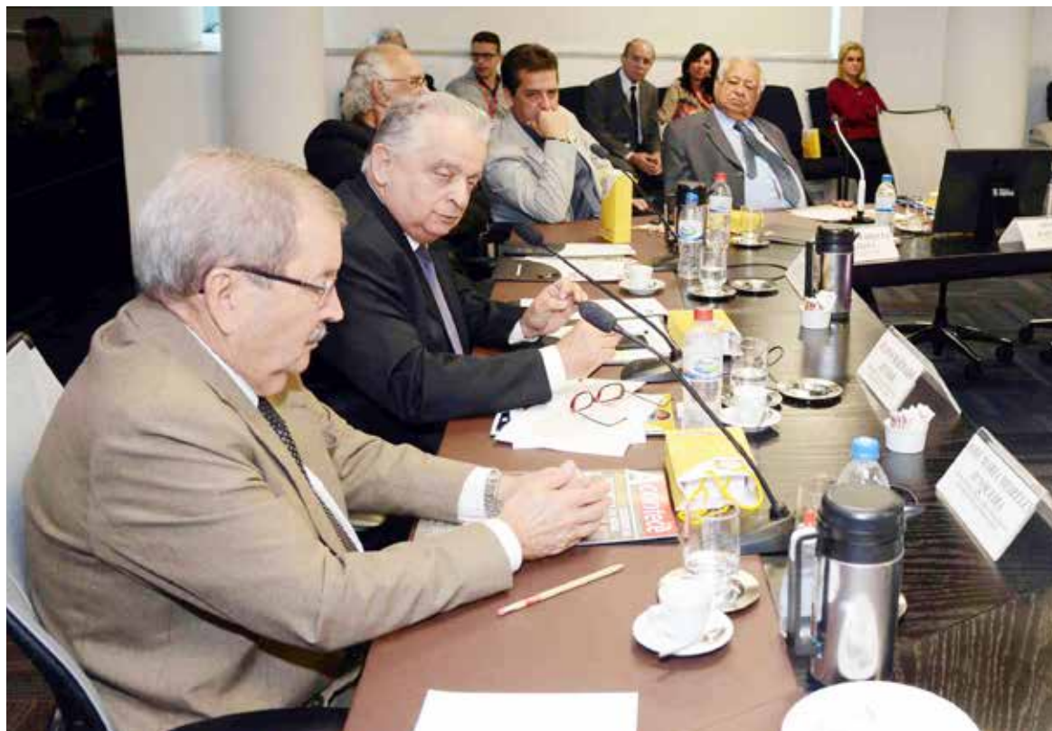
Fiemg e governo de Minas apostam em fiscalização preventiva para adequar empresas às regras ambientais