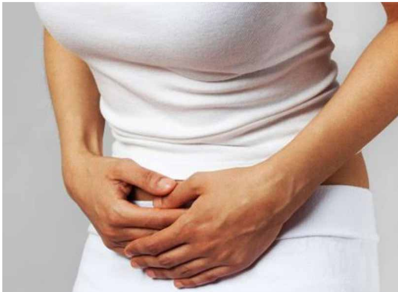
Impactos comportamentais provocados pela doença ainda são pouco debatidos