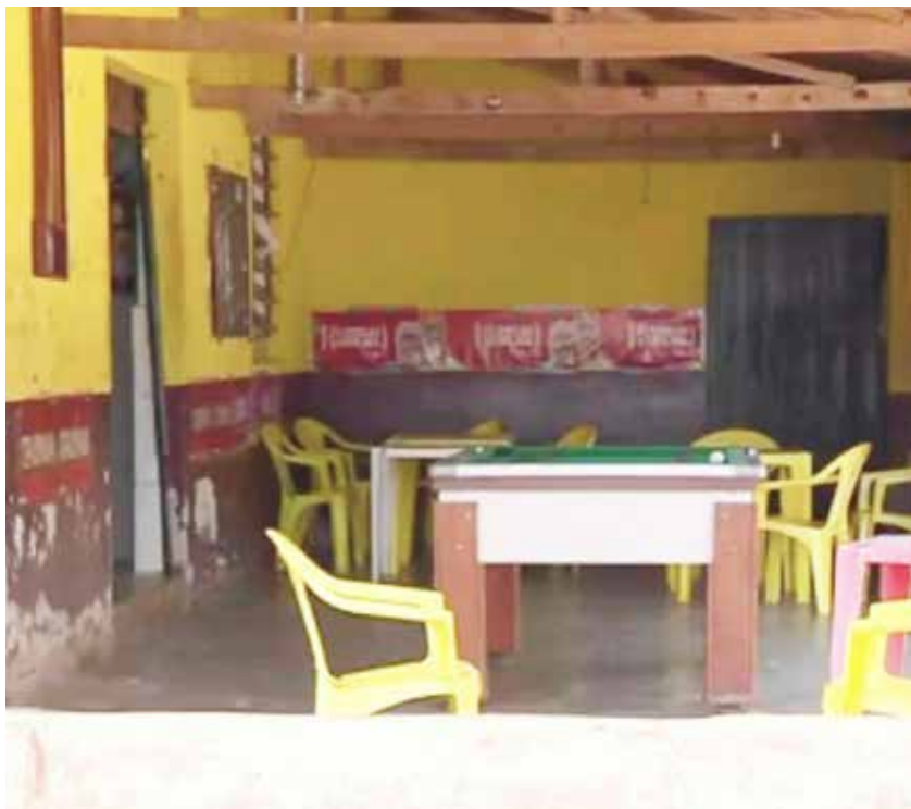
Assaltante disparou arma para assustar clientes do bar, foi quando o proprietário também fez disparos, acertando o bandido, que morreu no local