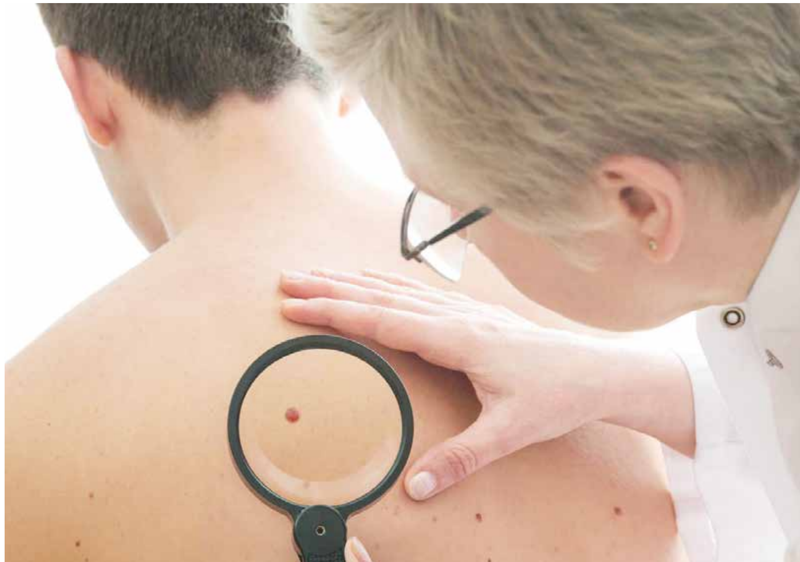
Em 2016, a estimativa de novos casos tipo melanoma foi de 5.670, sendo 3.000 em homens e 2.670 em mulheres

De acordo com o INCA (Instituto Nacional de Câncer José Alencar Gomes da Silva), o câncer de pele é mais comum em pessoas de pele clara, sensíveis à ação dos raios solares ou com doenças cutâneas prévias, com idade igual ou acima de 40 anos, sendo considerado raro em crianças e negros (exceto portadores de enfermidades cutâneas anteriores). A cura de pacientes está diretamente ligada ao diagnóstico e tratamento precoces, pois se observa melhores resultados quando feitos em estágios iniciais.