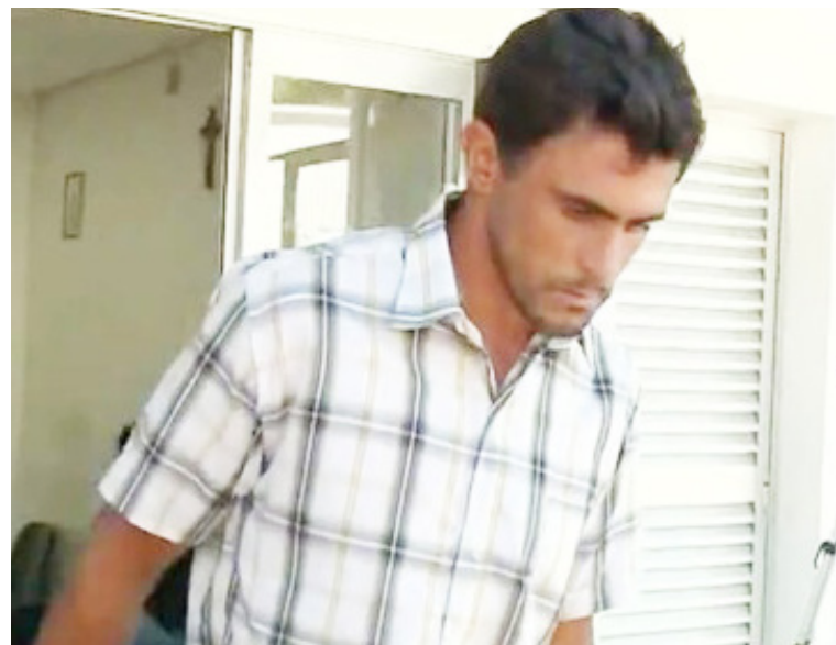
Pai que teria agredido bebê é levado ao presídio

família deve ser acompanhada por psicólogos, incluindo a mãe, para que futuramente se decida sobre o destino das crianças- há a possibilidade do casal perder a guarda dos filhos. O conselho também informou que cuidadoras e enfermeiras do abrigo vão ajudar a cuidar do bebê enquanto ele estiver internado.