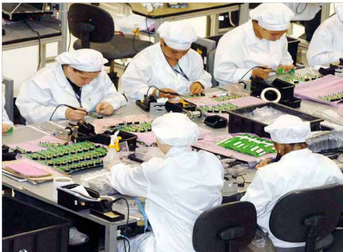
Faturamento das indústrias mineiras tem segunda alta seguida,

A expectativa é de que alguns setores voltem a contratar nos próximos meses, como alimentos, têxtil e couro e calçados. Para outros setores, a perspectiva é de re-