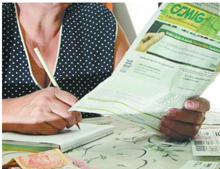
Mudança passou a valer na segunda-feira (03)