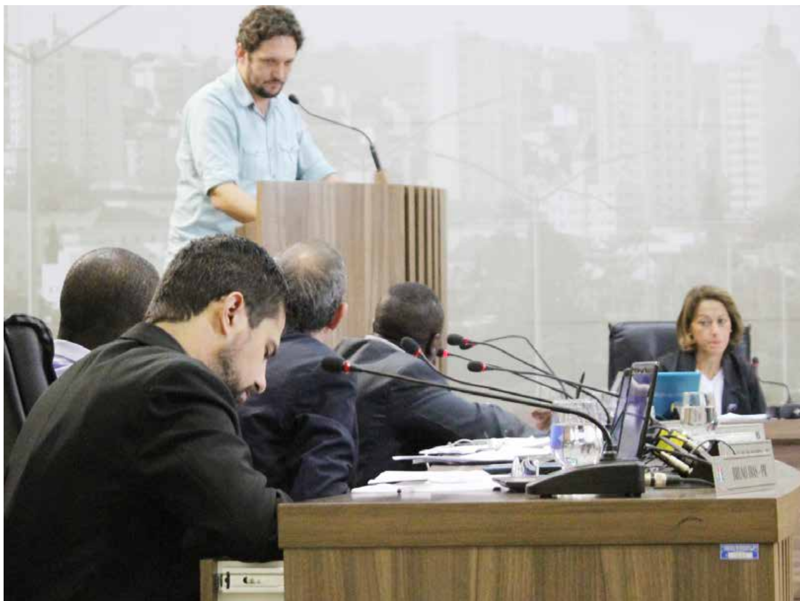
Vereadores durante a sessão da Câmara desta terça-feira (04)