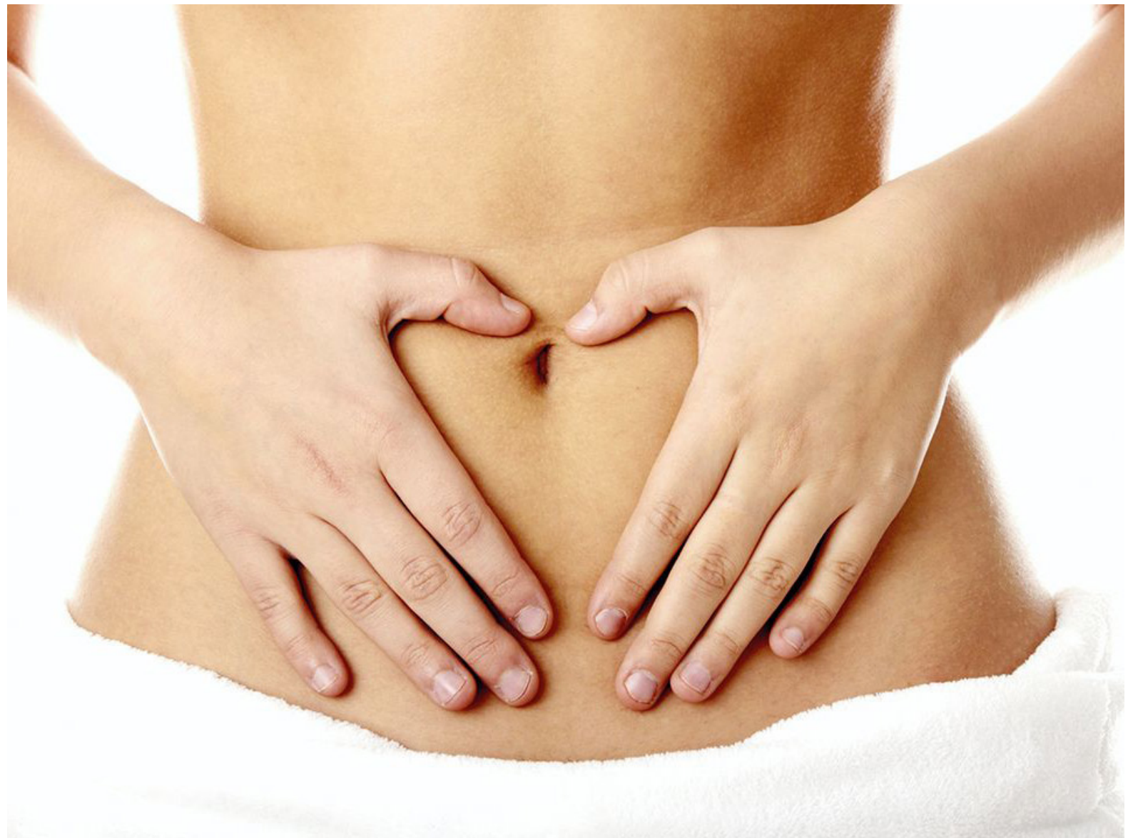
A Endometriose pode ocorrer entre a adolescência e a menopausa, em qualquer idade, mas a faixa dos 30-40 anos é a mais comum

É uma doença com impacto negativo em diversos aspectos da vida da mulher, inclusive na função sexual - Os principais sintomas da endometriose são representados por dor e infertilidade, relacionam-se diretamente com prejuízos na atividade sexual, mas aspectos específicos da