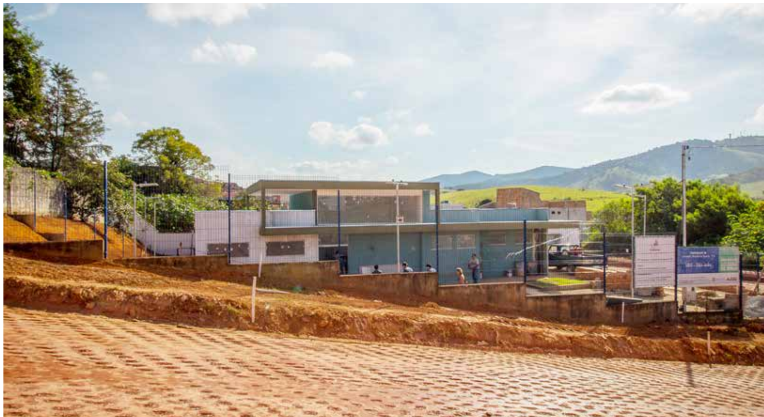
As obras da UBS do São João devem durar mais 30 dias de acordo com a Prefeitura

Dois setores, considerados prioritários, devem ser alvos da maior parte das ações: saúde e infraestrutura. Ambos têm sido alvo de reclamações dos moradores. Regiões como o Faisqueira e o São Cristovão cobram melhorias na pavimentação enquanto a falta de medicamentos é uma preocupação crescente entre os usuários das farmácias municipais. As críticas reverberaram com maior intensidade na Câmara, daí a razão de a força-tarefa ser anunciada na reunião com o parlamentares alinhados.