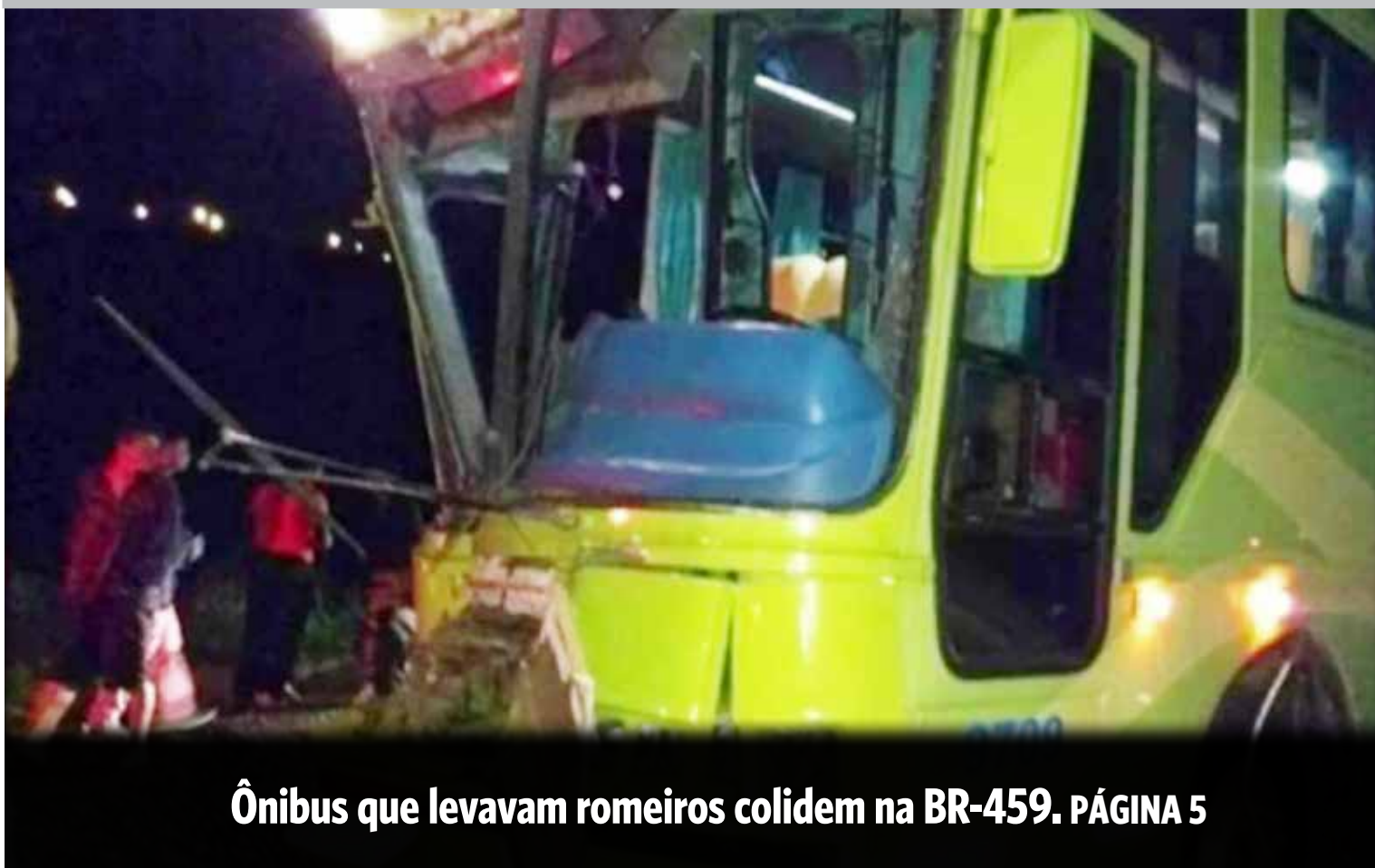
Ônibus que levavam romeiros colidem na BR-459. PÁGINA 5